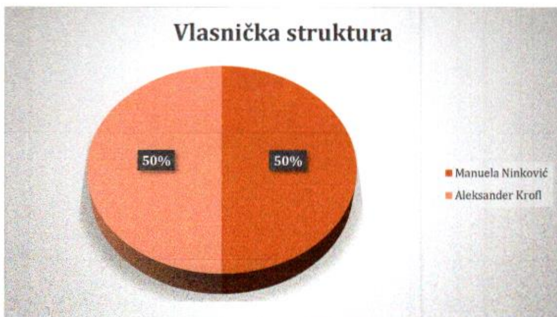
Grafički prikaz: Vlasnička struktura